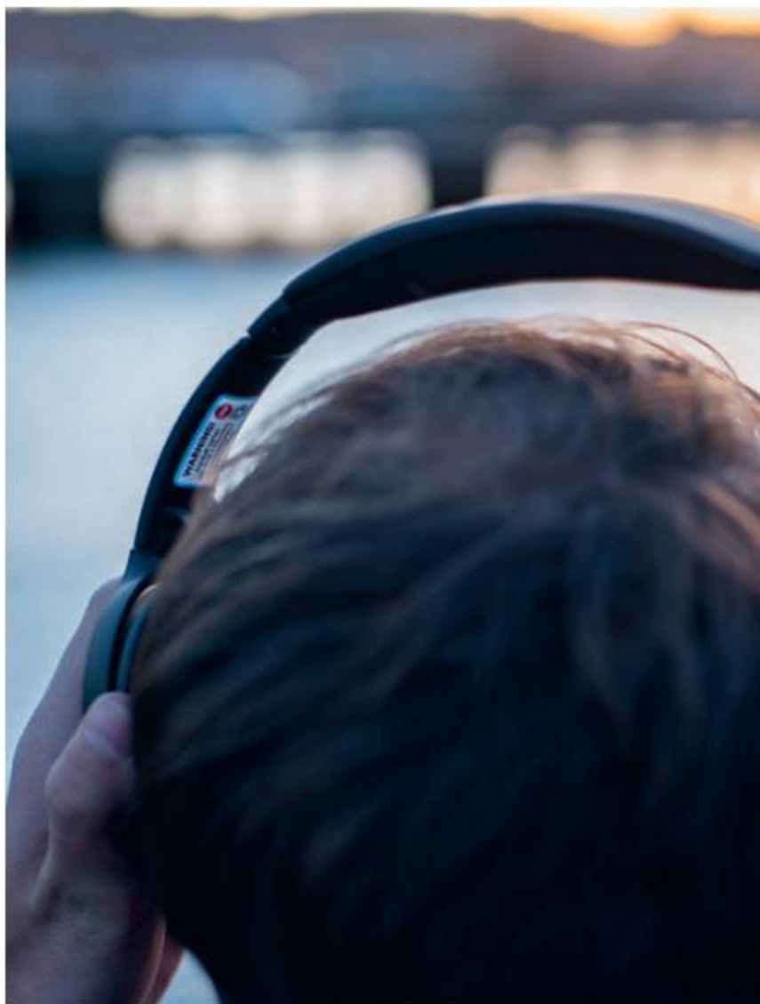
MärkDNA avskräcker tjuven och öka chanserna att få tillbaka stulna värdesaker

Ett flertal kampanjer rörande SSF:s DNA-märkning har också framgångsrikt genomförts med olika kommuner och försäkringsbolag under året. För att ytterligare bredda och utveckla vår produktportfölj kommer vi under 2018 att introducera två riktade produkter från Datatag för märkning av utombordsmotorer och cyklar och även andra typer av märkningar planeras att lanseras.