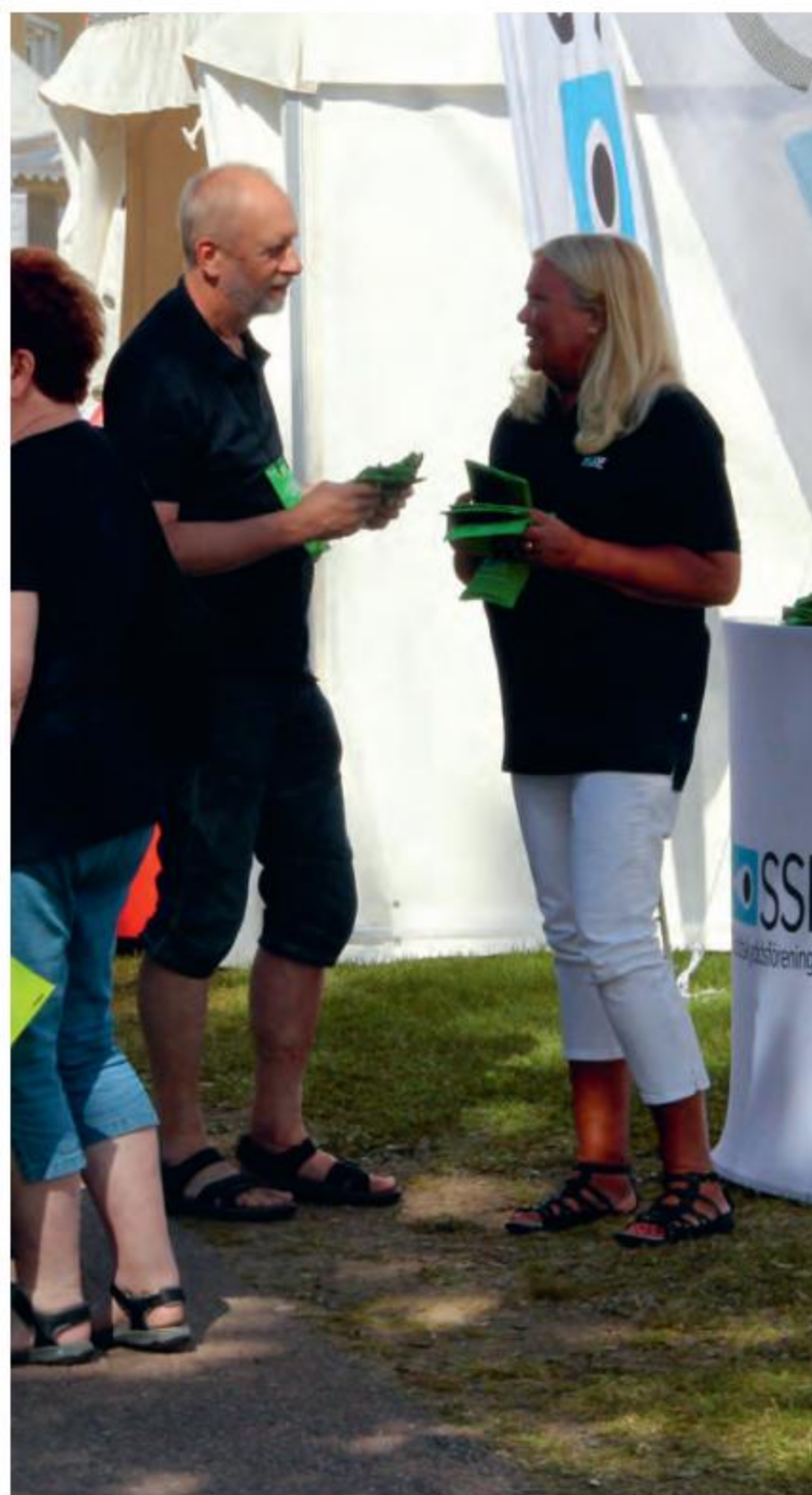
Lokalstyrelsen i Dalarna delar ut festivalväskor under dansbandsveckan i Malung.

SSF arbetar löpande med att skapa nytta för medlemmarna genom att driva säkerhets- och trygghetsfrågor och erbjuda kostnadsfria seminarier. 2017 hade SSF 27 aktiva medlemmar och 202 stödjande medlemmar.