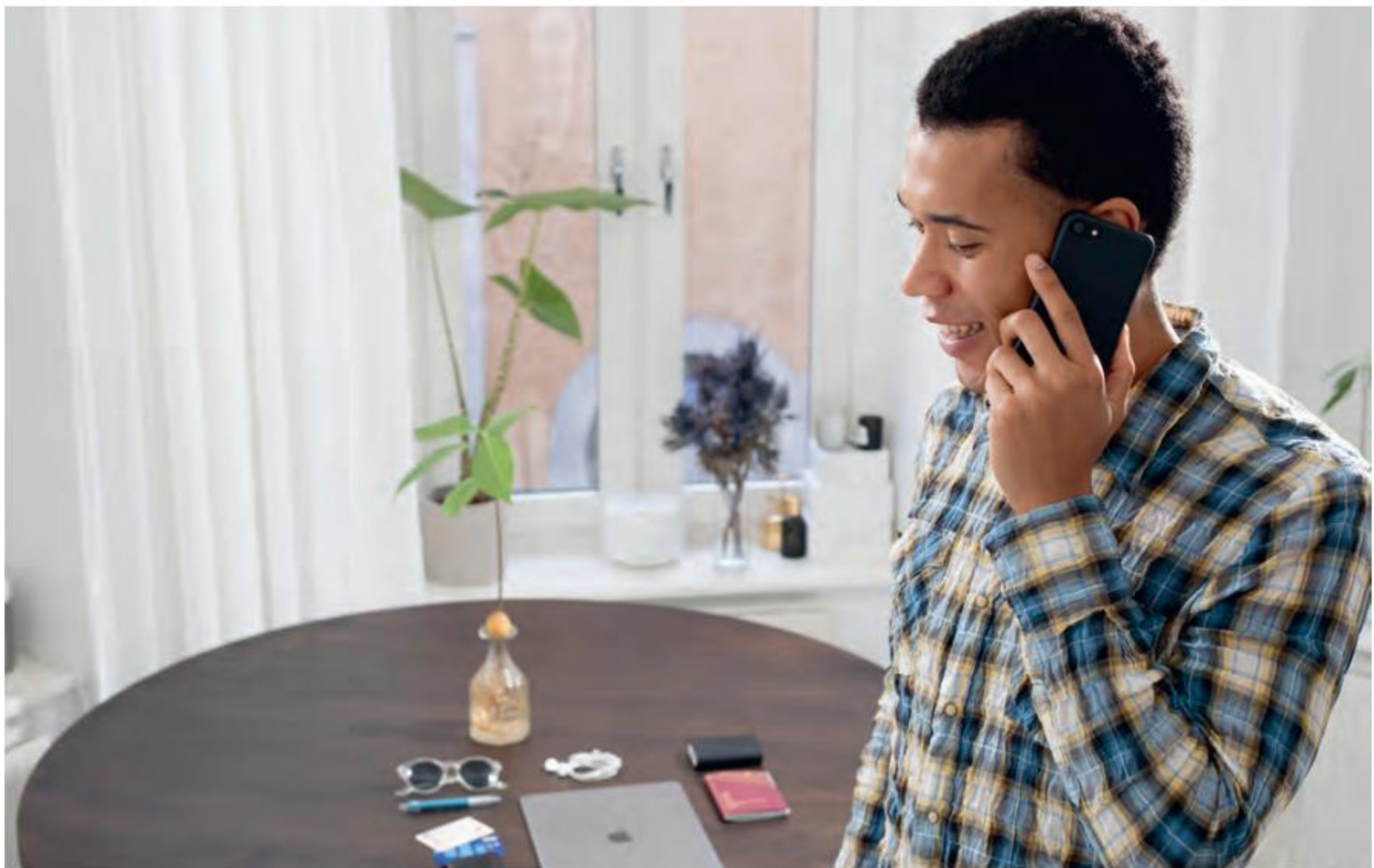
Ring ett enda samtal med SSF Spärrtjänst för att spärra dina saker.